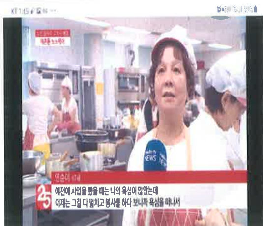
CJ헬로비전 방송 상영