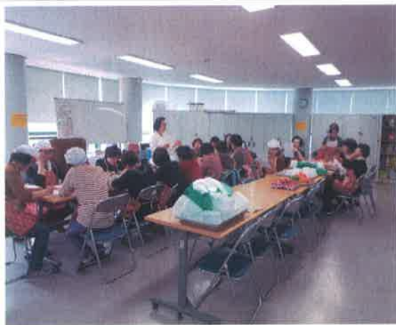
노노케어 반찬 강습