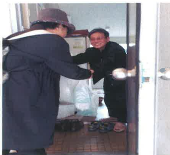
안부확인 및 반찬 전달